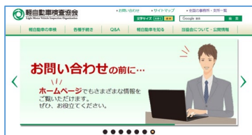
トップページを下方にスクロール

https://www.keikenkyo.or.jp/procedures/attached/0000058469.docx